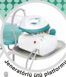
Jeneratörlü ütü platformu