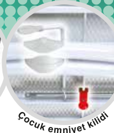
Çocuk emniyet kilidi