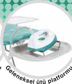
Geleneksel ütü platformu