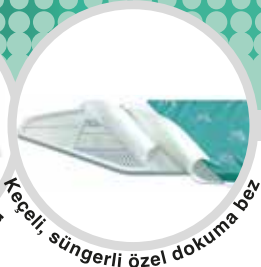
Keçeli, süngerli özel dokuma bez