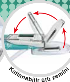
Katlanabilir ütü zemini