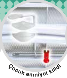
Çocuk emniyet kilidi