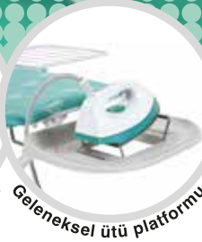
Geleneksel ütü platformu