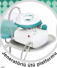
Jeneratörlü ütü platformu