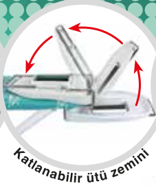
Katlanabilir ütü zemini