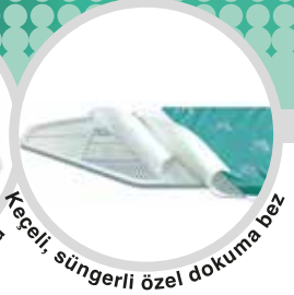
Keçeli, süngerli özel dokuma bez

Çocuk emniyet kilidi. Ergonomik özelliği ile oturarak dahi ütü yapabilmeye imkanı. Katlandığında 8 cm yükseklikle dar boşluklara yerleştirebilme kolaylığı. Çift profilli denge çubuğu ile, maksimum denge imkanı ve kolay yükseklik ayarlama tertibatı. 42x120 ebadında geniş kullanışlı ütölleme yüzeyi.